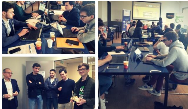
L'équipe d'étudiants de L'ECAM Lyon qui devançait même les industriel-les à la mi-journée !