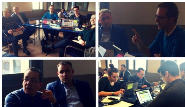
Le cabinet Advents consulting pour qui le serious game The Fresh Connection a été un formidable vecteur de team building.