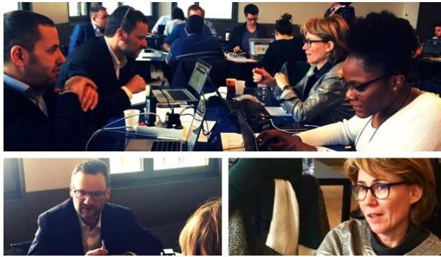
Une étudiante de l'ECAM Lyon parfaitement intégrée au sein d'une équipe composée d'industriel-le de Sanofi et de Clasquin, toutes deux entreprises adhérentes Fapics.